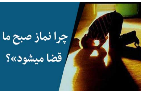
چرا نماز صبح ما قضا میشود؟

اما هنگامی که می خواهید نماز بخوانید و با الله صحبت کنید و قرار ملاقات با الله ذولجلال