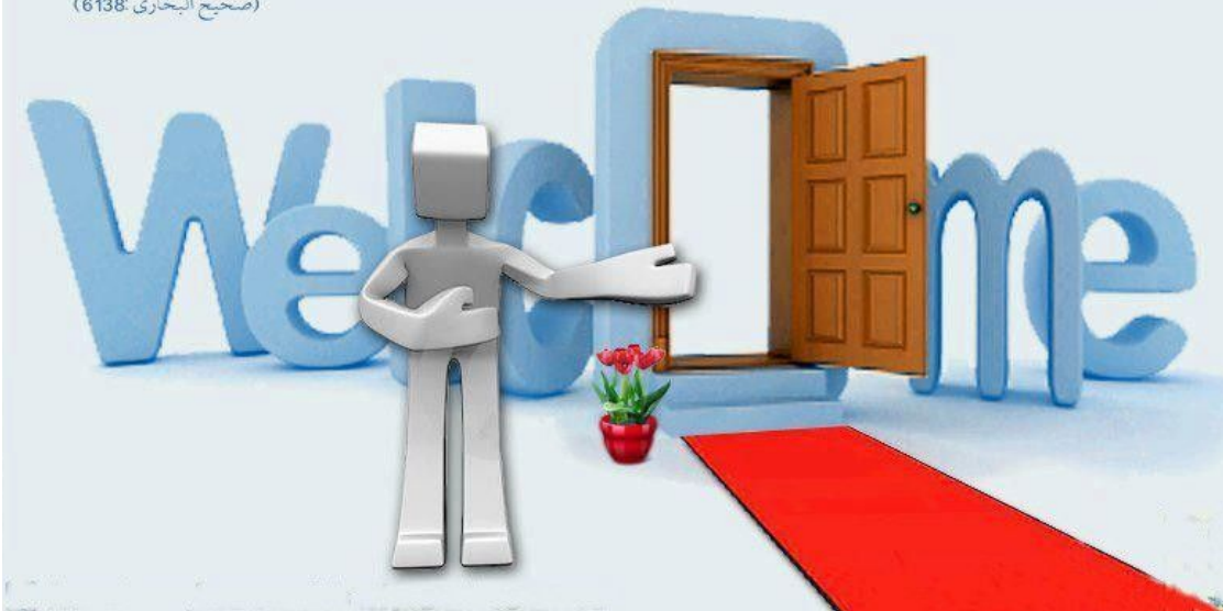
table gift)" [Sahih Muslim].

Islam attaches great importance to social practices and values (e.g., honouring guests) which deepen the bonds of brotherhood/unity and increase cooperation and empathy within communities. Hospitality in Islam is a multi-faceted practice and thus not limited to the generosity that we show guests who visit our homes but extends beyond our walls towards our neighbours as well as the wider community, particularly during times of need (e.g., natural disasters). In Islam, guests who visit our homes must receive our utmost kindness and generosity. The same principle applies whether the guest is a family member, a stranger, rich or poor, a Muslim, or non-Muslim.